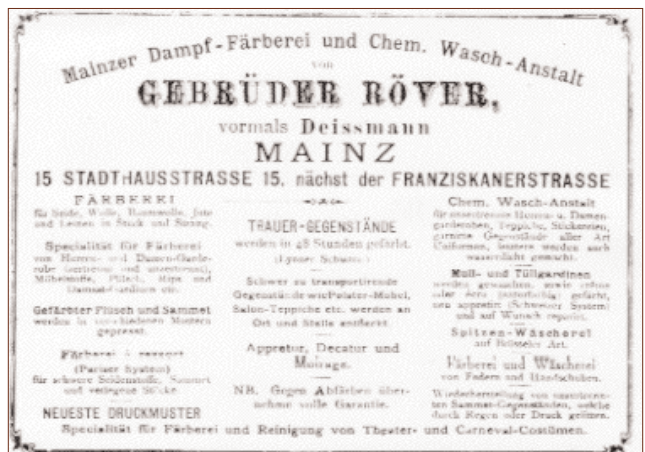
(Auch im Jahr 1891 erschien ein gleiches Inserat).